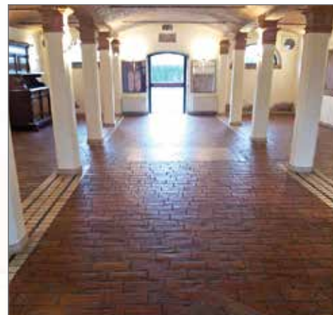
Foto 1 - Trattamento pavimentazione in Klinker e pietre naturali