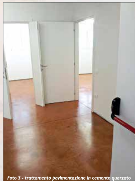
Foto 3 - trattamento pavimentazione in cemento quarzato