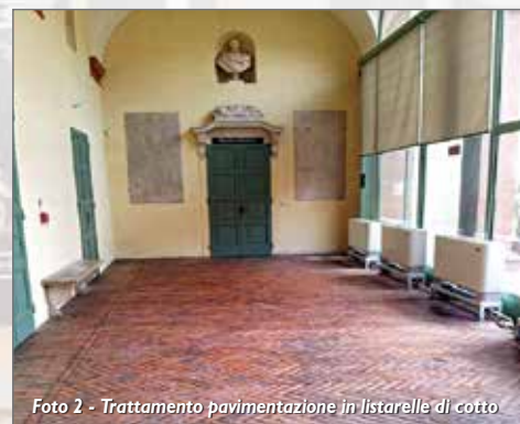
Foto 2 - Trattamento pavimentazione in listarelle di cotto